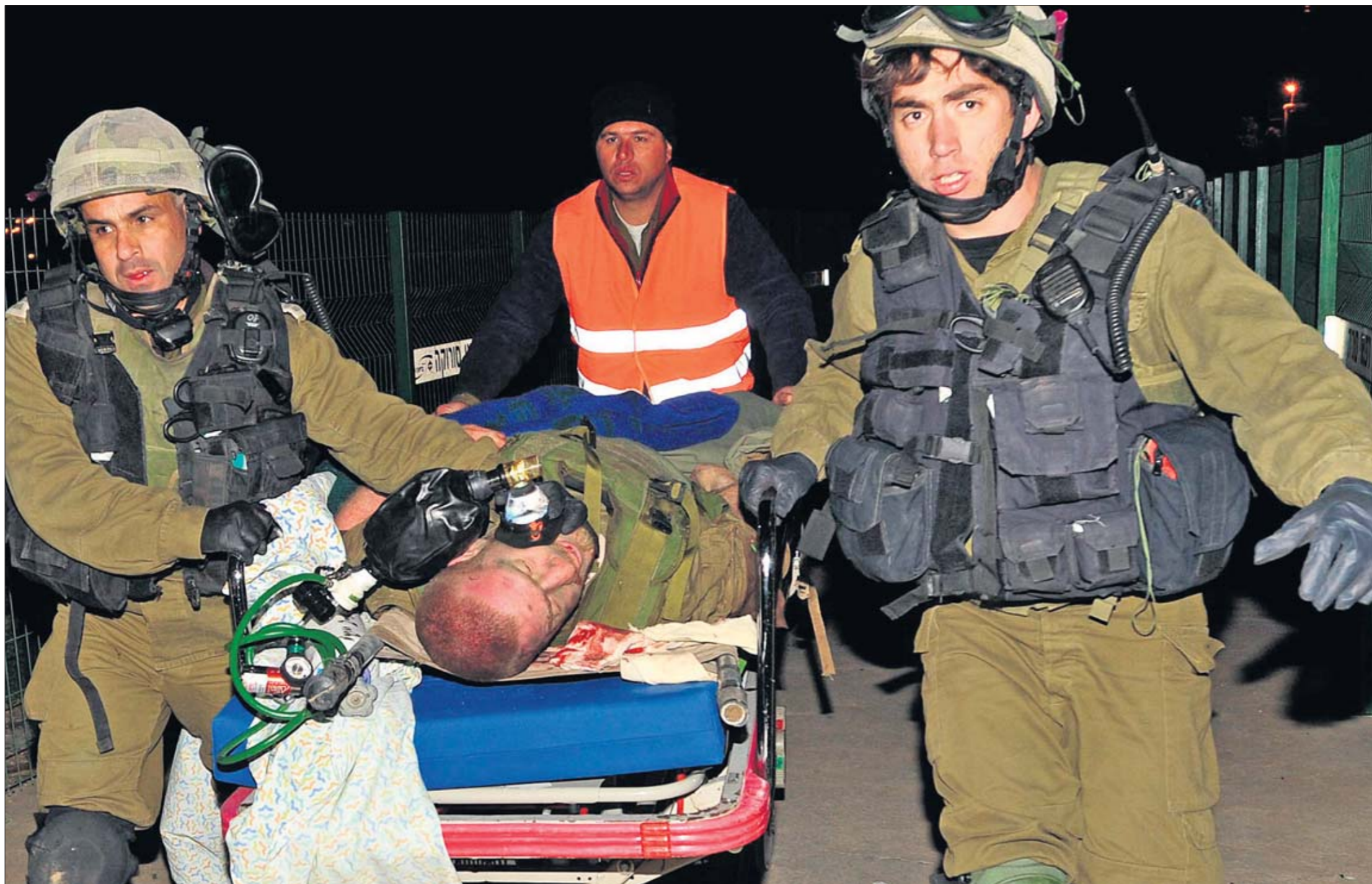
Israelische Soldaten transportieren einen bei der Bodenoffensive verwundeten Kameraden zum Krankenhaus in der Stadt Beersheba.